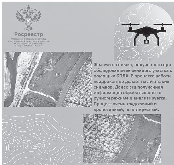
Фрагмент снимка, полученного при обследовании земельного участка с помощью БПЛА. В процессе работы квадрокоптер делает тысячи таких снимков. Далее вся полученная информация обрабатывается в ручном режиме и анализируется. Процесс очень трудоемкий и кропотливый, но интересный.